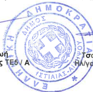
Τσαπέτης Κων/νος Ηλ/γος Μηχ/κός ΤΕ4 / Α