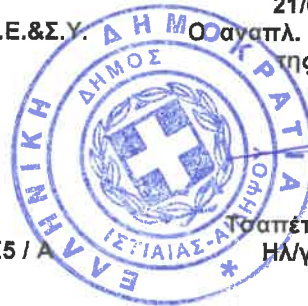
Τσαπέτης Κων/νος Ηλ/γος Μηχ/κός ΤΕ4 / Α