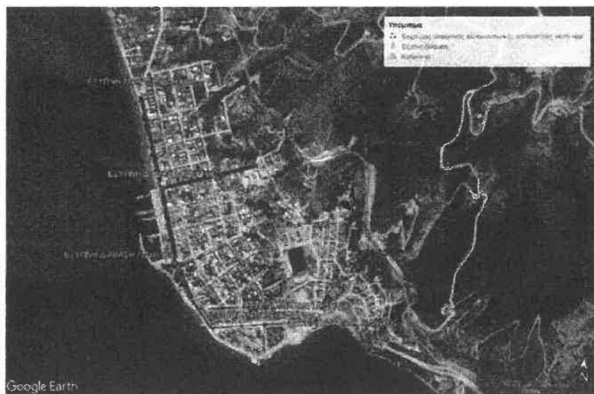
Εικόνα 1: Σημεία Αιδηψός

Τα παραπάνω σημεία παρουσιάζονται στις εικόνες 1-4.