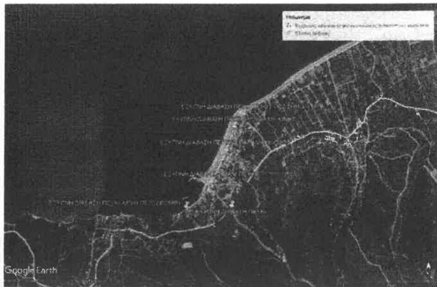
Εικόνα 3: Σημεία Πευκί