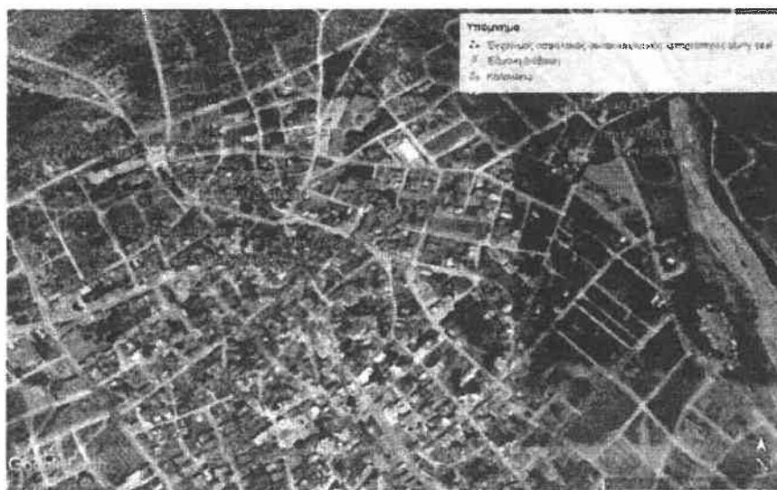
Εικόνα 2: Σημεία Ιστιαία