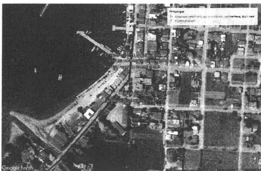
Εικόνα 4: Σημεία Ωρεοί

Εκτός από τις έξυπνες διαβάσεις θα τοποθετηθούν κολονάκια και προστατευτικά κιγκλιδώματα στα παρακάτω σχολεία: