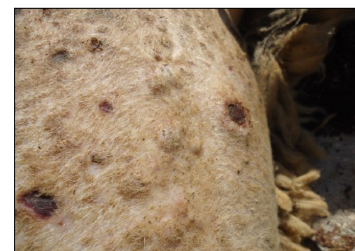
Προχωρημένες αλλοιώσεις ευλογιάς. Μαύρα κάπαλα (εφελκίδες).