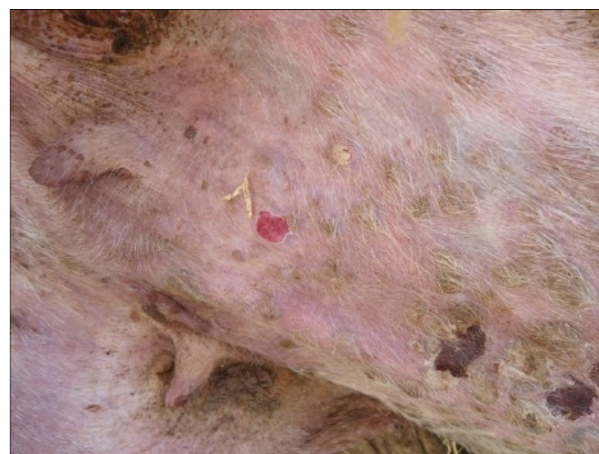
Προχωρημένες αλλοιώσεις ευλογιάς. Μαύρα κάπαλα (εφελκίδες) και πληγές (έλκη) στο ίδιο ζώο.