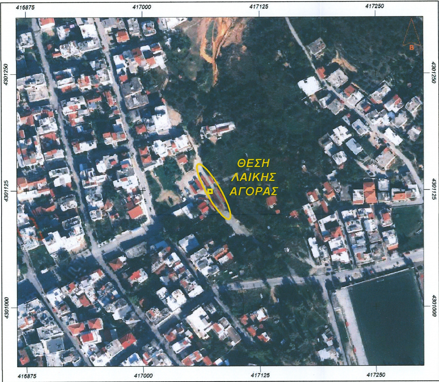
ΑΠΟΣΠΑΣΜΑ ΟΡΘΟΕΙΚΟΝΑΣ ΚΤΗΜΑΤΟΛΟΓΙΟΥ ( https://maps.gov.gr/gis/map/ )